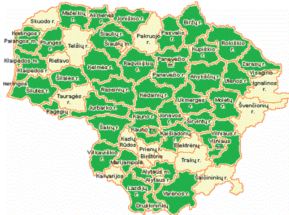
1 pav. Savivaldybių žemėlapis. Žaliai pažymėtose savivaldybėse gyvena tyrime dalyvavę respondentai

Surinkti duomenys iš įvairių Lietuvos savivaldybių. Iš 17 savivaldybių nebuvo gauta nei vienos užpildytos anketos. Aktyviausiai apklausoje dalyvavo Vilniaus miesto savivaldybės amatininkai (14 apklausos dalyvių), Radviliškio rajono savivaldybės amatininkai (11 apklausos dalyvių) ir Utenos rajono savivaldybės amatininkai (8 apklausos dalyviai).