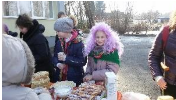
Kalėdų senelis ir Snieguolė Sužionių pagrindinėje mokykloje

Sužionių pagrindinėje mokykloje tradiciškai švenčiamos Advento vakaronės, kuriose dalyvauja Kalėdų Senelis ir Snieguolė.