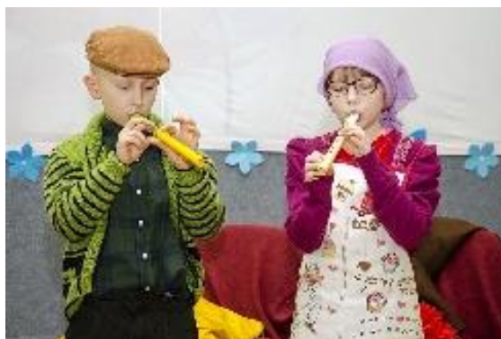
„Dzień Babci i Dziadka (Bobutės ir dieduko)“ dienas Buivydiškių pradinėje mokykloje