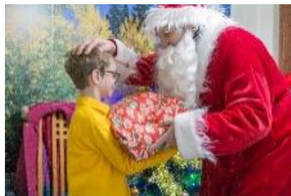
Kalėdų senelis Riešėje

Riešės bendruomenės nariai ne vienus metus inicijuoja Kalėdų Senelio, Snieguolės ir elfų vaikštynes po bendruomenės namus, kuriuose auga vaikai.