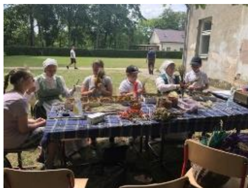
Dvaro diena Buivydiškėse

Birželio mėn. Buivydiškių pagrindinėje mokykloje vyksta kasmetinė Dvaro diena, kurios tikslas – puoselėti tradicinius lietuvių liaudies amatus. Popamokinėje veikloje mokyklos vaikai vyksta į kitus Lietuvos regionus susipažinti su kitų etninių grupių tradicijomis, pvz., į Trakų kavinę „Le Vivier“ susipažinti su karaimų tradicijomis ir papročiais bei išmokti kepti kibinus.