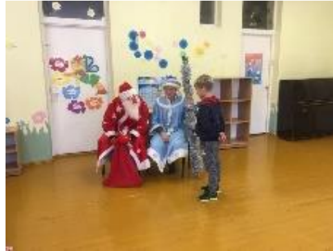
Kalėdų senelis ir Snieguolė Sužionių pagrindinėje mokykloje

Kiekvienais metais bendruomenės nariai su Kalėdų Seneliu aplanko apie 200 vaikų iki 10 m. amžiaus, ir jiems įteikia dovanėles.