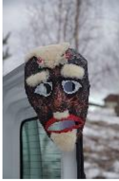
Užgavėnių kaukė, pagaminta Riešės bendruomenės narių

Dar viena gera proga susiburti kartu – Velykų šventė. Prieš šventę visi mokosi marginti margučius. Kai jau visos šventės praūžia ir būna laisvo laiko, susirenkama į keramikos seminarą.