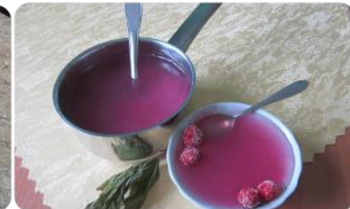
Šventinis aviečių kisielius