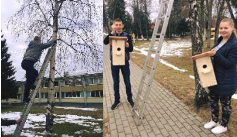
Inkilų kėlimas Sužionių pagrindinėje mokykloje

Rudenį, artėjant Vėlinėms, mokytojai kartu su mokiniais lanko kapines, jas tvarko, uždega žvakutes. Mokiniai kartu su mokytojais taip pat keliauja į Zalavo dvarą – J. Pilsudskio gimtinę. Prie jo paminklo skaitomi prisiminimai, degamos žvakutės.