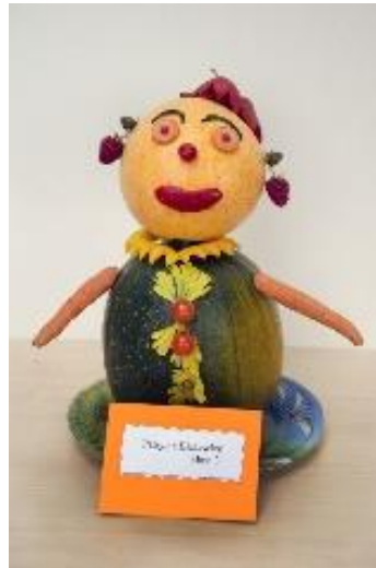
Derliaus gėrybės Buivydiškių pradinėje mokykloje

Gegužės mėn. minimos Tarptautinės šeimos dienos proga Vilniaus r. Buivydiškių pradinėje mokykloje vyksta vaikų, tėvų ir pedagogų šventė. Šventės metu koncertuojama, pagerbiamos mamos, močiutės, tėveliai, seneliai. Buivydiškių pradinės mokyklos pedagogai rengia vaikams edukacines ekskursijas į kitus Lietuvos regionus susipažinti su duonos kepimo tradicija. Buivydiškių pradinėje mokykloje švenčiamos Užgavėnės, Velykos, Kalėdos. Pasak mokytojų, Kaziuko mugėje, kuri organizuojama pačioje mokykloje, mokiniai supažindinami su senovės lietuvių amatais, jų sąsajomis su šiomis dienomis. Kaip ir daugelyje kitų šio rajono mokyklų, švenčiama Bobutės ir Dieduko diena – Dzień Babci i Dziadka.