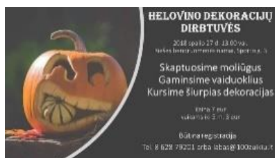
Helovino dekoracijų dirbtuvių plakatas

Riešės bendruomenė. Riešės bendruomenė labai aktyvi. Jos organizuojami renginiai labai įvairūs. Spalio pabaigoje bendruomenė inicijuoja Helovino dekoracijų dirbtuves, kurių metu skaptuoja moliūgus, „gamina“ vaiduoklius, kuria šiurpias dekoracijas.