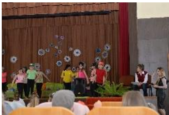
Buivydiškių pradinėje mokykloje vaikų, tėvų ir pedagogų šventė

Birželio mėn. Buivydiškių pagrindinėje mokykloje vyksta kasmetinė Dvaro diena, kurios tikslas – puoselėti tradicinius lietuvių liaudies amatus. Popamokinėje veikloje mokyklos vaikai vyksta į kitus Lietuvos regionus susipažinti su kitų etninių grupių tradicijomis, pvz., į Trakų kavinę „Le Vivier“ susipažinti su karaimų tradicijomis ir papročiais bei išmokti kepti kibinus.