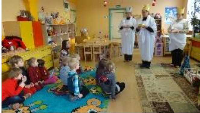
Trijų karalių šventė Buivydžiškių darželyje

Buivydžiškių darželyje yra populiarūs Trijų karalių šventė, švenčiama Duonelės šventė, rudenėlio šventė, Kalėdos, Užgavėnės. Užgavėnių kaukes vaikai gaminasi kartu su auklėtojomis darželyje.