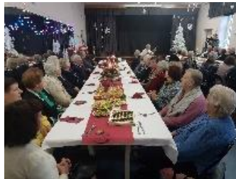
Riešės bendruomenės senjorai advento vakaronėje

Advento metu į bendruomenės patalpas popietei kviečiami senjorai. Senjorai vaišinami, jiems surengiamas nedidelis koncertas. Prieš Kalėdas bendruomenė renkasi į dirbtuves, kuriose mokosi daryti šiaudines dekoracijas, iš šiaudų gamina eglutei žaisliukus, riša sodus.