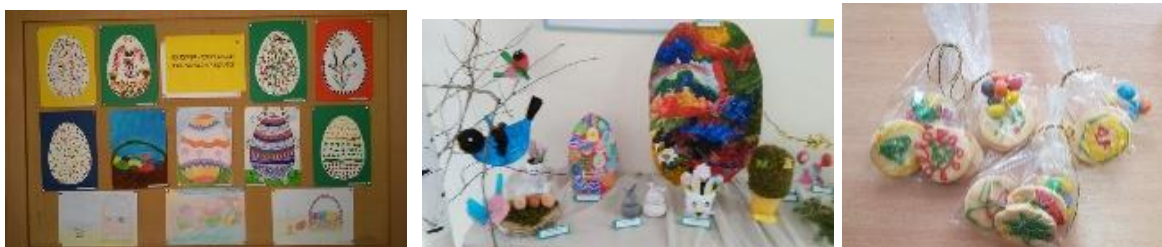
Velykos Riešės gimnazijoje

Riešės gimnazijos 1–4 kl. mokiniai organizuoja parodas konkursus „Velykinis margutis“. Parodose eksponuojami įvairia technika išmarginti margučiai: tapyti, lipdyti, klijuoti, pinti, siuvinėti ir kitaip išpuošti naudojant popierių ar kitas medžiagas. Prieš Velykas vaikai kartu su seneliais, tėveliais ir pedagogais gamina velykines kompozicijas, kurios vėliau keliauja į parodą „Velykinės kompozicijos“.