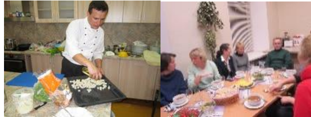
Maisto gamimas Maišiagalos bendruomenės centre su profesionaliu šefu

maisto receptus, išleisti receptų knygą, taip išsaugant Vilniaus krašto tradicijas, papročius. Surengtoje maisto gaminto vakaronėje dalyvavo profesionalus šefas, mokęs maisto gaminto gudrybių.