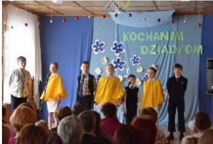
Močiutės ir senelio diena (Dzień Babci i Dziadka)

Riešės šv. Faustinos Kovalskos pagrindinėje mokykloje