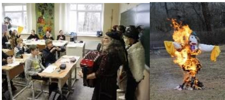
Užgavėnės Paberžės „Verdenės“ gimnazijoje

Gimnazijoje noriai švenčiamos žiemos palydos – Užgavėnės. Moksleiviai patys kuria Užgavėnių personažus, kepa blynus. Persirengėliai per pamokas vaikštinėja po mokyklą. Vėliau šventė persikelia į gimnazijos kiemą, kuriame organizuojamos įvairios varžybos: blynų mėtymas į keptuves, lenktynės su blynais, riestainių konkursas. Šventę vainikuoja pagrindinio personažo, Kanapinio, pergalė prieš Lašininį ir sudeginama Morė.