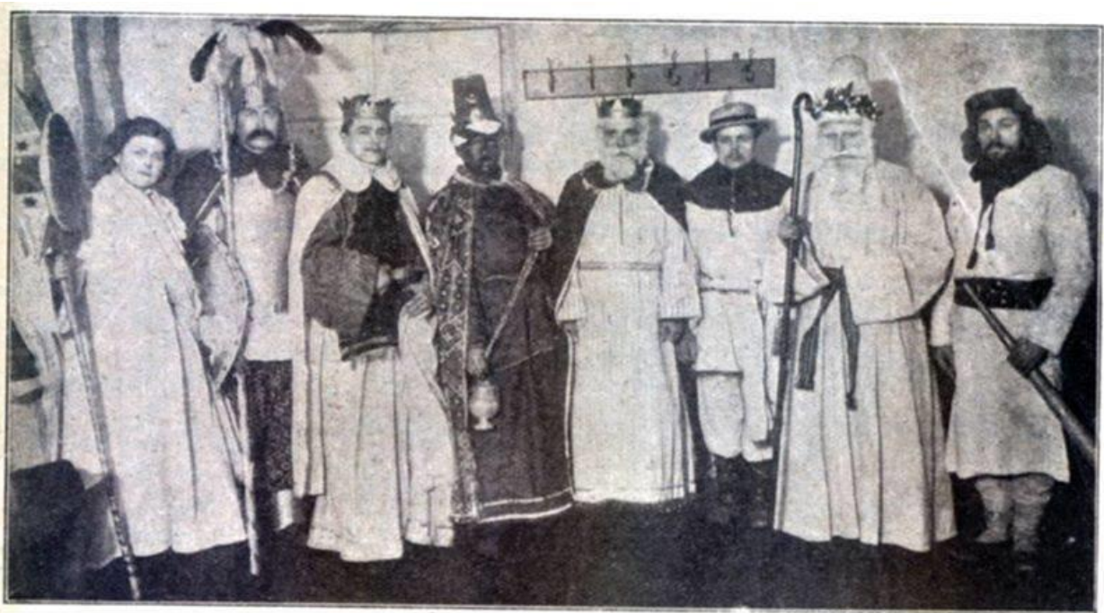
Trys Karaliai ir Krivių Krivaitis Vilniaus krašte 1904 ir 1905 m. (sausio 5, 6 ir 7 d.)

Nuotrauka Trys Karaliai ir Krivių Krivaitis Vilniaus krašte 1904 ir 1905 m.