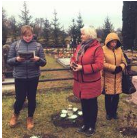
Vėlinės Zalavo dvare Sužionių pagrindinė mokykla

Moksleiviai taip pat lankosi Glitiškių dvare, kuriame veikia keramikos studija, – ten jiems rengiami edukaciniai keramikos užsiėmimai.