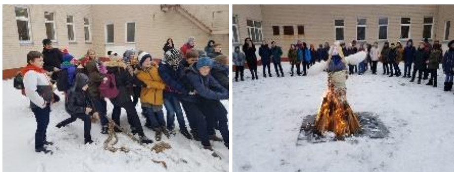
Užgavėnės Riešės gimnazijoje

Tradiciskai keliaujant metų ratu, mažieji ikimokyklinukai pedagogų iniciatyva organizuoja Kaziuko mugę. Tradicine švente tapęs renginys skatina vaikus gaminti šiai šventei skirtus darbelius, kurie vėliau keliauja į improvizuotą mugę ant „prekystalių“. Vaikai gamina papuošalus iš karoliukų, muilo, vaško, daro lankstinius iš popieriaus, darbelius iš molio. Smaližiai gali įsigyti įvairiausių skanėstų: saldainių, sausainių, vaflių, pyragų ir kitų kepinių. Pasak iniciatorių, šis renginys vaikus moko gražiai bendrauti, domėtis įvairiomis gamybos technologijomis, estetiškai pateikti savo gaminius, ugdo praktinius skaičiavimo įgūdžius.