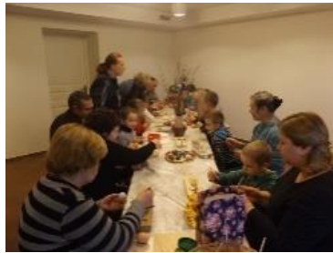
Kiaušinių marginimo pamokėlė

Houvaltų dvare, be tradicinių amatų centro, veikia Maišiagalos kultūros centras, miestelio biblioteka, bendruomenės namai, koncertų salė ir parduotuvėlė, kurioje kiekvienas norintis gali įsigyti suvenyrų.