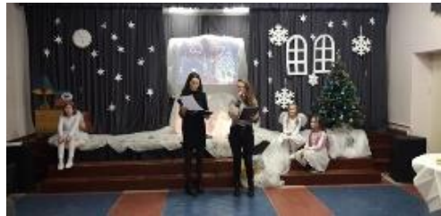
Adventas Riešės gimnazijoje

Pavasariį prieš Velykas Riešės gimnazijos ikimokyklinukai rengia akciją „Margu margučius“. Jos metu vaikai susipažįsta su įvairiais margučių marginimo būdais: tradiciniu marginimu vašku bei svogūnų lukštais, taip pat išmoksta margučius marginti dekupažo technika.