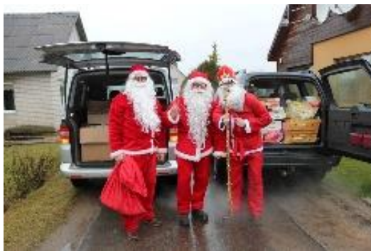
Sužionių bendruomenės Kalėdų seneliai