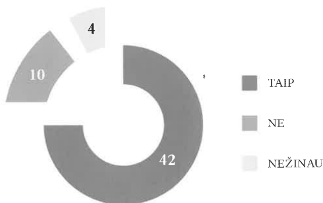
2 pav. 56 respondentų atsakymai į klausimą „Ar būtina saugoti šią tradiciją?“

Dauguma respondentų mano, kad apie šią tradiciją žino ir kitose Lietuvos vietovėse, nes ne kartą šyvio šokdiniame buvo rodomas per Lietuvos televiziją. Į klausimą, ar būtina šią tradiciją saugoti, pritarė beveik visi respondentai (2 pav.).