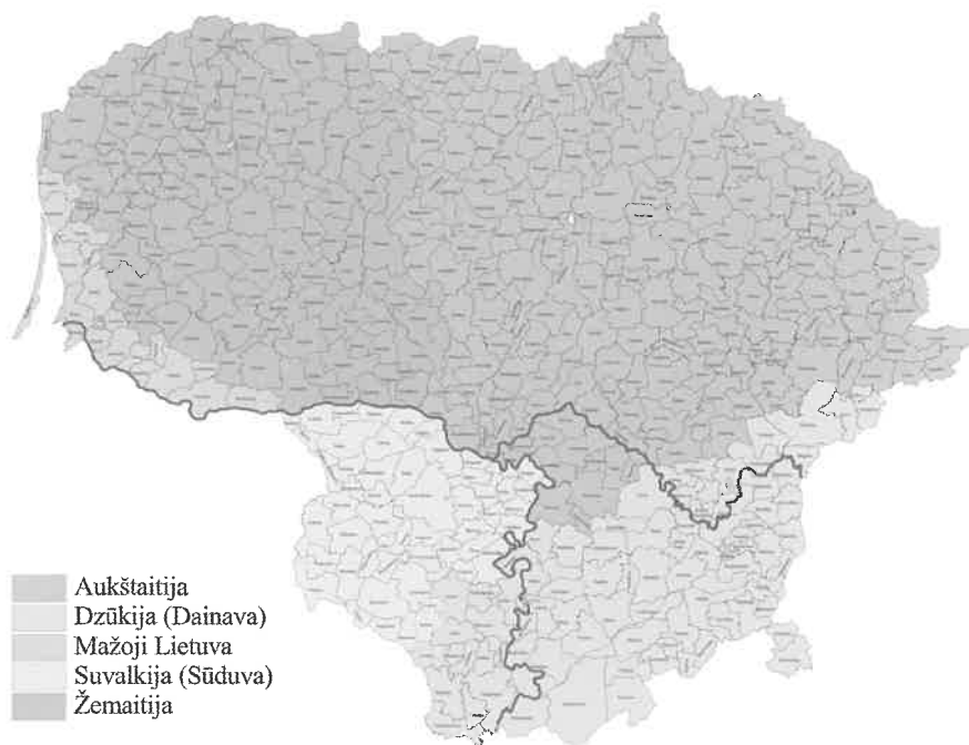
1 pav. Lietuvos etnografiniai regionai ir jų ribos. Žemėlapis autoriai D. Pivoriūnas ir Ž. Šaknys

Svarbiausia, kad esminis Latvijos administracinis, politinis pertvarkymas sustiprino jos tarptautinį įvaizdį, sudarė palankesnes sąlygas šalies, jos regionų ir vietos bendruomenių tapatumo išsaugojimui ir sustiprinimui. Būtina pasinaudoti šios šalies patirtimi, nes esame tame pačiame geografiniame, istoriniame ir politiniame baltų kultūros areale. Turime aktyviau plėtoti regioninį etnokultūrinių kraštų bendradarbiavimą, nes taip lengviau pasireikšime ir tarptautinėje erdvėje, ir greičiau perimsime kitų ES regionų geriausią patirtį šioje srityje.