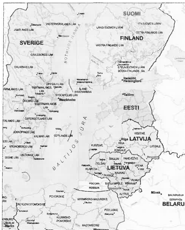
4 pav. Europos Sąjungos žemėlapis fragmentas. Išleido: ES Komunikacijos generalinis direktoratas. 2012 m., Briuselis