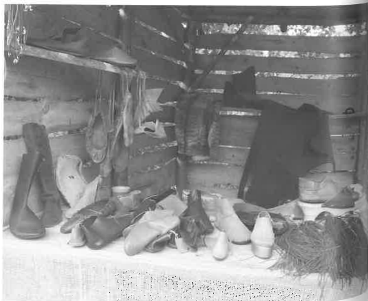
Odininkų darbų ekspozicija Kernavėje, 2014 m.

dar laisva lietuviško suvenyro niša. Tautinis kostiumas, įgaunantis vis daugiau regioninių ypatumų, išgyvena pakilimą, tačiau pasigendame tautinio kostiumo naudojimo kaip tarptautinio reprezentacinio apdaro. Tautinės juostos, išsivadavusios iš tautinio kostiumo, tampa savarankišku, kiekvieną etnografinį kraštą reprezentuojančiu suvenyru. Juolab kad ir eksponuoti joms tautodailininkai