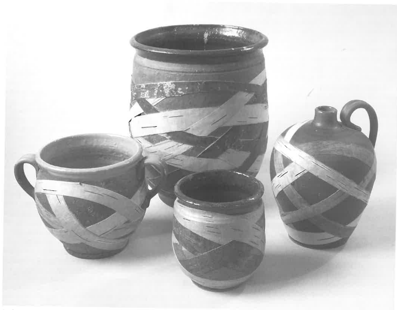
Molio indai, puošti tošimi

Etninės kultūros globos taryba, el. p. etnosuduva@gmail.com