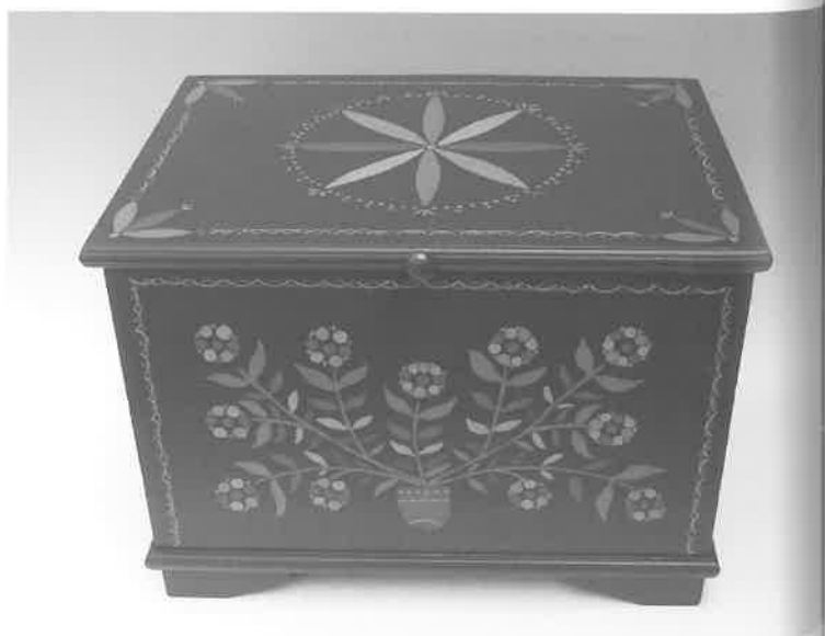
Pagal papročius motinos kraičio skrynja atitekdavo vyresniajai dukrai.

Svarbu pastebėti, kad Užnemunės skrynios buvo vien kraitinės, o kraičio, taip pat ir skrynios, neturėti mergelei sudarė negarbę. Iš kraitinių skrynių kiekio ir sunkumo buvo sprendžiama apie ištekančios mergelės darbštumą, antra, iš kraitinių skrynių raštų gražumo, pasak žmonių pasakojimų, buvo sprendžiama mergelės grožio pamėgimas. Prieš