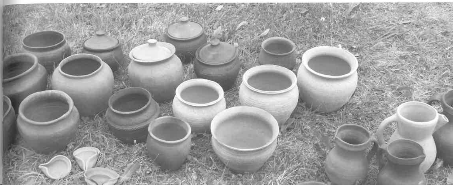
Archajiška keramika Kernavėje, 2014 m.

apdangalų ir drabužių puošybai panaudoti lėšio formos gintarai, apeiginę reikšmę turėję gintariniai amuletai – viskas, ką turime tradicinio. Prie tradicinio tautinio kostiumo dar ir dabar dažnai dėvimi gintariniai karoliai yra tarpukarinio patriotizmo ir tautinio simbolio paieškų išdava, nes tradicinis moterų tautinio kostiumo papuošalas buvo raudoni koralų karoliai.