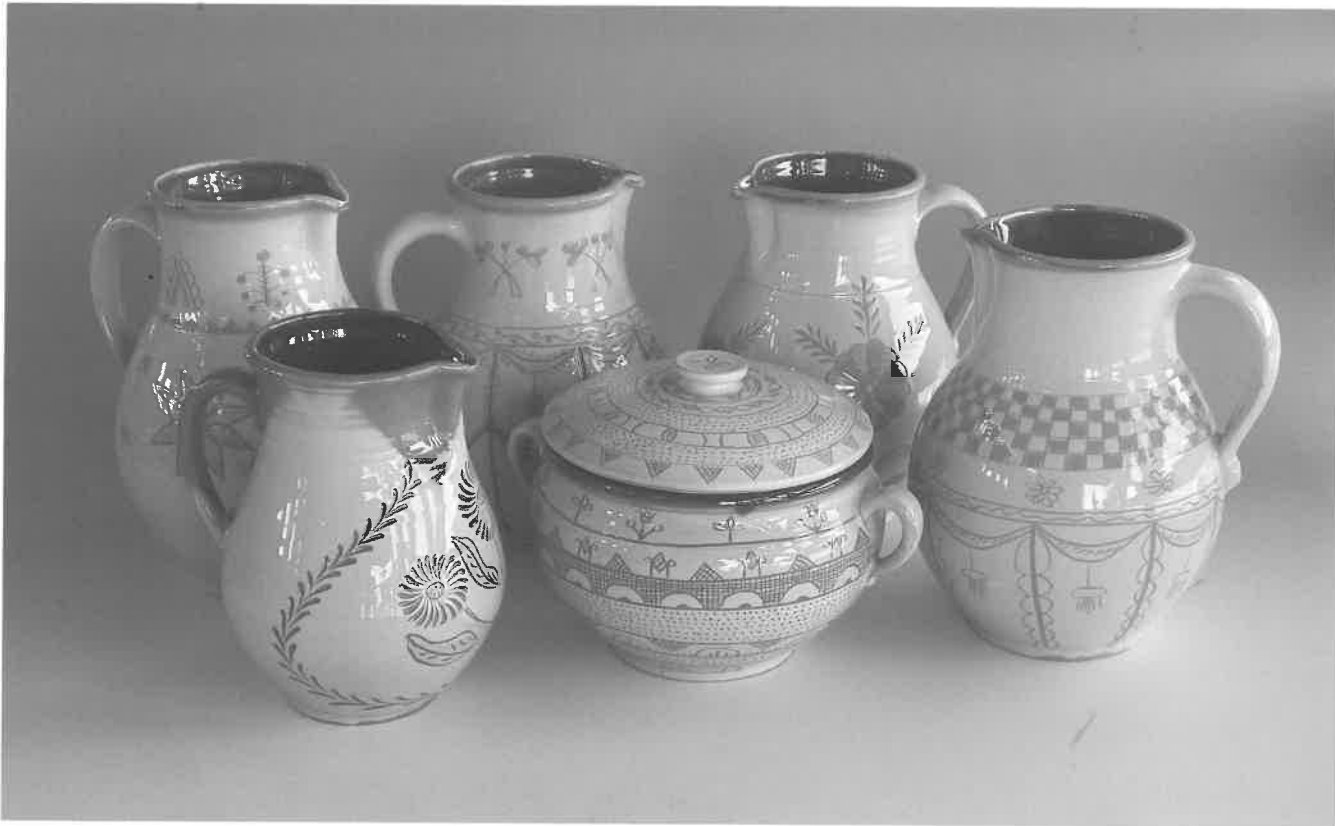
Tradacijos puoselėjimas ir improvizacija puikiai dera tarpusavyje.

išmonės. Galbūt tai sovietinio laikotarpio palikimas ar kūrybinės savirealizacijos ambicijos padaryti „kad ir nežmoniškai – bele kitoniškai“, ar pataikavimas pirkėjo skoniui, kurį formuojant prisidėjo tie patys kūrėjai, praėjusį dešimtmetį vykdę užsakymus Vokietijos, Šiaurės šalių užsakovams ir dalį dirbinių realizuodami mugėse Lietuvoje.