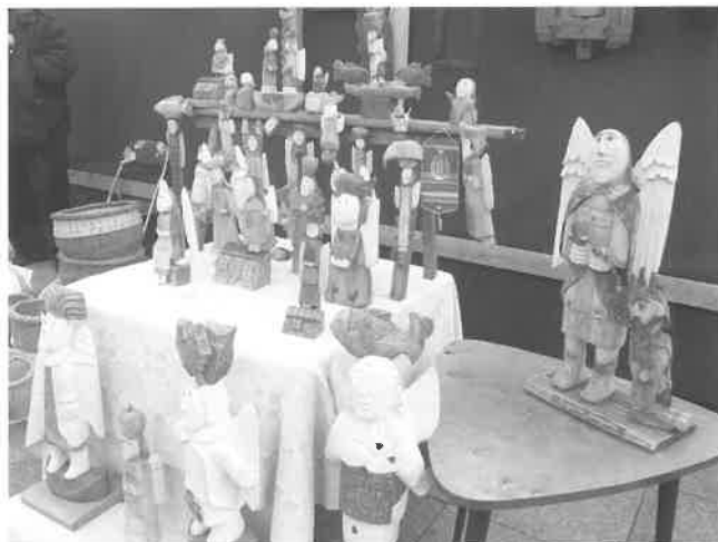
Skulptūrėlių stalielis mugėje, 2014 m.

Kiek komplikuočiau žanras; archeologiniai žalvario papuošalai Europoje tapatinami su vikingų kultūriniu palikimu, todėl reikia nuolatinių pastangų juos populiarinant kaip lietuviškus. Dar labiau prieštaringas gintaro kaip „Lietuvos aukso“ simbolis. Gal dėl to, kad ištisus šimtmečius buvome praradę priėjimą prie jūros, nesusiformavome gintaro papuošalų kūrimo ir dėvėjimo tradicijų. Iš neolito laikų mus pasiekę archeologiniai radiniai – galvos