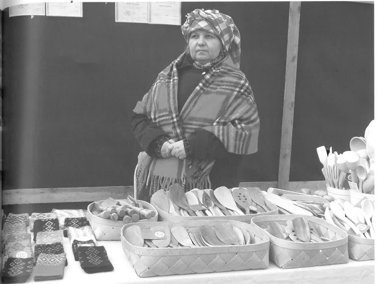
Tai, kas per šimtmečius išstobulinta, – reikalinga ir šiandien. Kaziuko mugėje, 2014 m. Vilnius.

grupės, todėl ir yra labai tinkamas ir informatyvus applan-kyto krašto „prisiminimas“.