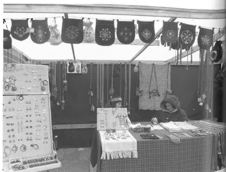
Kaziuko mugėje šalia kitų tradicinių gaminių gali rasti ir įmantriai išpuoštą „delmoną“. 2014 m., Vilnius. Nuotr. V. Jocio

Žinoma, neuzurpuojame visos „suvenyro“ erdvės, tačiau dirbame toje, kurią geriausiai išmanome ir neignoruodami, ir nenuvertindami miestų ar dvarų kultūros siūlome vieną iš suvenyro grupių kurti, remiantis etninės kultūros gyvąja tradicija – tautodaile ir tradiciniais amatais. Europos dailės srovės, dvarų ir miestų kultūra su nedidelėmis išlygomis bendra visam žemynui, o tradicine kultūra besiremianti etninė kultūra dar ir šiandien labai ryškiai charakterizuoja Europos šalis, regionus, tautas, etnines