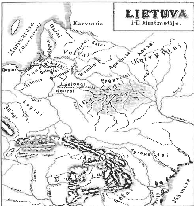
3 pav. J. Basanavičiaus sudarytas žemėlapis, 1893 m.

neaišku, kaip XIX a. save vadino ar buvo kitų vadinami panašios dzūkų tarmės gyventojai tarp Nemuno ir Neries. Gerokai vėliau, 1928 m. straipsnyje apie latakinių dzūkų dainas, J. Basanavičius išskėlė prielaidą, jog dzūkai gali būti kilę iš senovės trakų tautos dalies dakų (sen. graik. djakoi ), vėliausiai paminėtų II a. pradžioje Transilvanijoje (Rumunija), kurių vardas galėjo būti tariamas ir kaip dzakai . Jo teigimu, „Dzakų arba dzūkų, kaip ir kitų Lietuvos kraštų dainose dažnai randame minėta Dunojaus, kaip atsiminimo liekana iš gilios senovės, kuomet lietuvių tautos palei tą upę gyventa“ (Basanavičius 1928: 101–102).