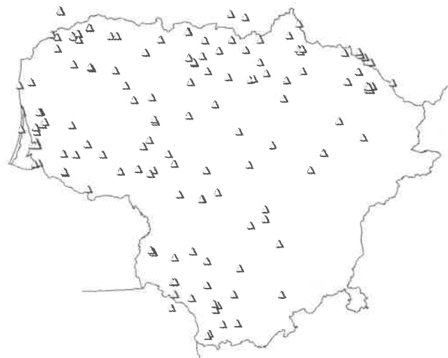
4 pav. Joninių laužai Lietuvoje 1920–1940 m.

per Joninių įvaizdį akcentuoti garbingą Lietuvos praeitį, ją iškelti prieš šių regionų gyventojų konfesinius skirtumus, įsitvirtinti atgautame Klaipėdos krašte (Šaknys, 2001: 76–78).