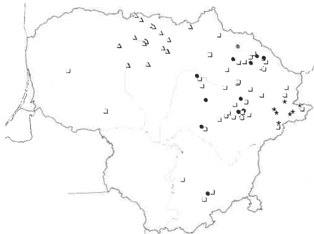
2 pav. Sekminių sambūriai Lietuvoje 1890–1940 m.