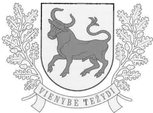
Suvalkijos (Sūduvos) herbas

Herbas ir vėliava. Lietuvos heraldikos komisija 2015 m. balandžio 2 d. suderino ir patvirtino Suvalkijos (Sūduvos) etnografinio regiono heraldinius simbolius, kuriuos sukūrė dailininkas Rolandas Rimkūnas.