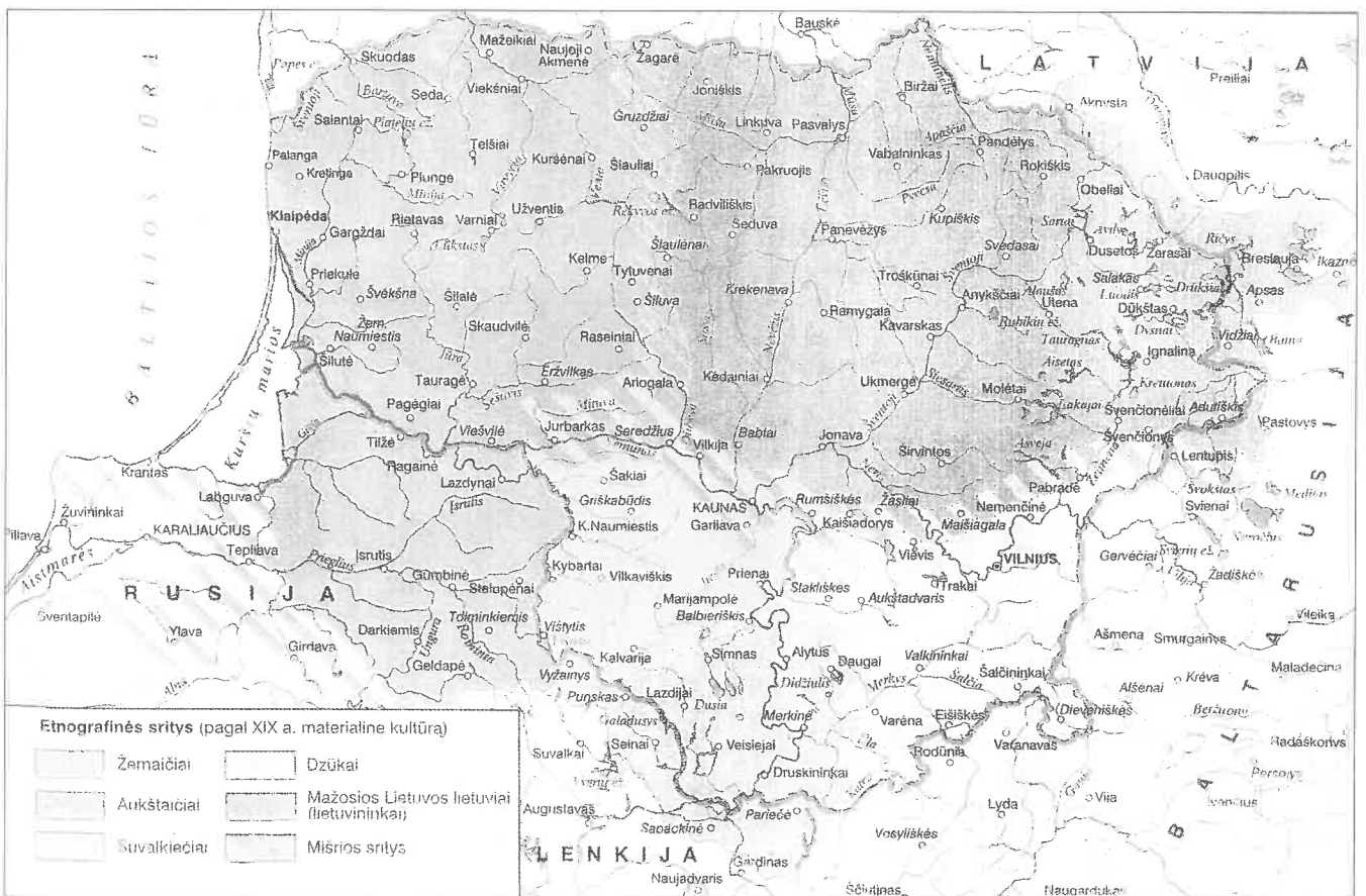
Lietuvos etnografinis žemėlapis, 1999 m.

Tarp Lietuvos etnografinių regionų esančios maždaug 10–15 km plotą apimančios ribinės vietovės pasižymi regioninių požymių įvairove. Ši įvairovė netolygi pagal skirtingą paveldo pobūdį, kadangi kiekviena paveldo rūšis turi savitus savo raidos dėsnumus: pavyzdžiui, vieno regiono požymius gali turėti architektūra, kito regiono – tarmė, tačiau su ja nebūtinai turi sutapti muzikinio folkloro ypatumai. Toks regioninių savitumų susimaišymas vyko ir dėl