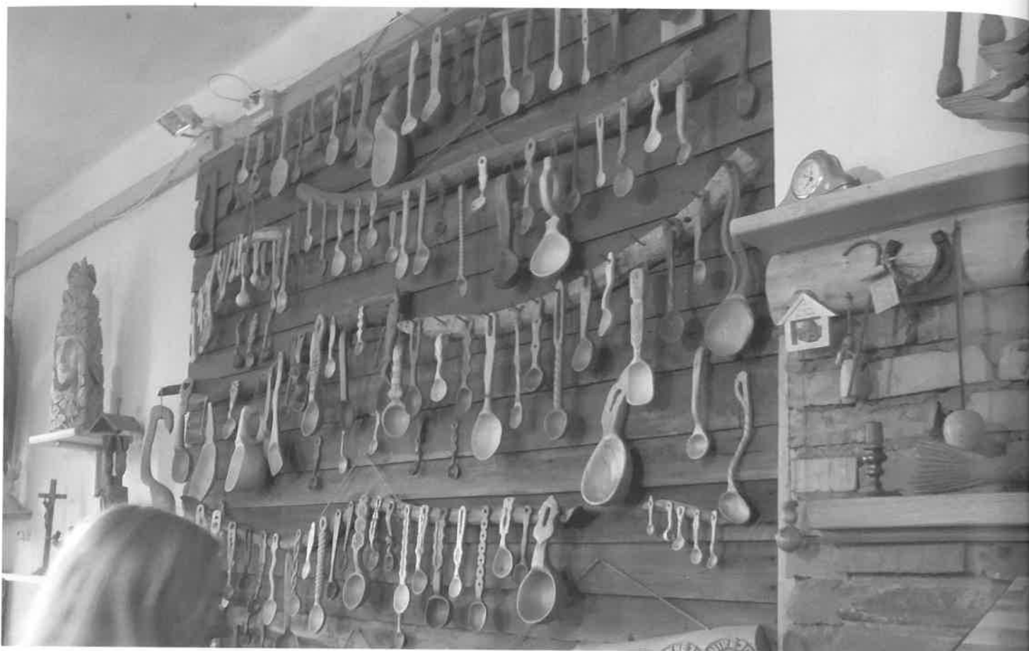
Šaukštų meistrų išmonei ribų nėra, 2015 m. Nuotr. V. Jocio

vestuvėse, vakarėliuose ir laidotuvėse. Itin populiarios šiame regione yra bandonijos, labiausiai išgarsėjo Eržvilko (Tauragės r.) bandonininkai. Regione galima išskirti tris instrumentinių ansamblių tipus: styginių instrumentų; dūdų; mišrius. Bene seniausi yra styginių ansambliai, kuriuos sudarydavo 5–12 žmonių, grojančių smuikais, gitaromis, mandolinomis, balalaikomis ir basetlėmis. Šiuos ansamblius pamažu išstūmė dūdų orkestrai. Šiaurės vakarų Žemaitijoje populiarūs įvairios sudėties mišrūs ansambliai: smuikas, armonika arba bandonija ir basetlė arba būgnas.