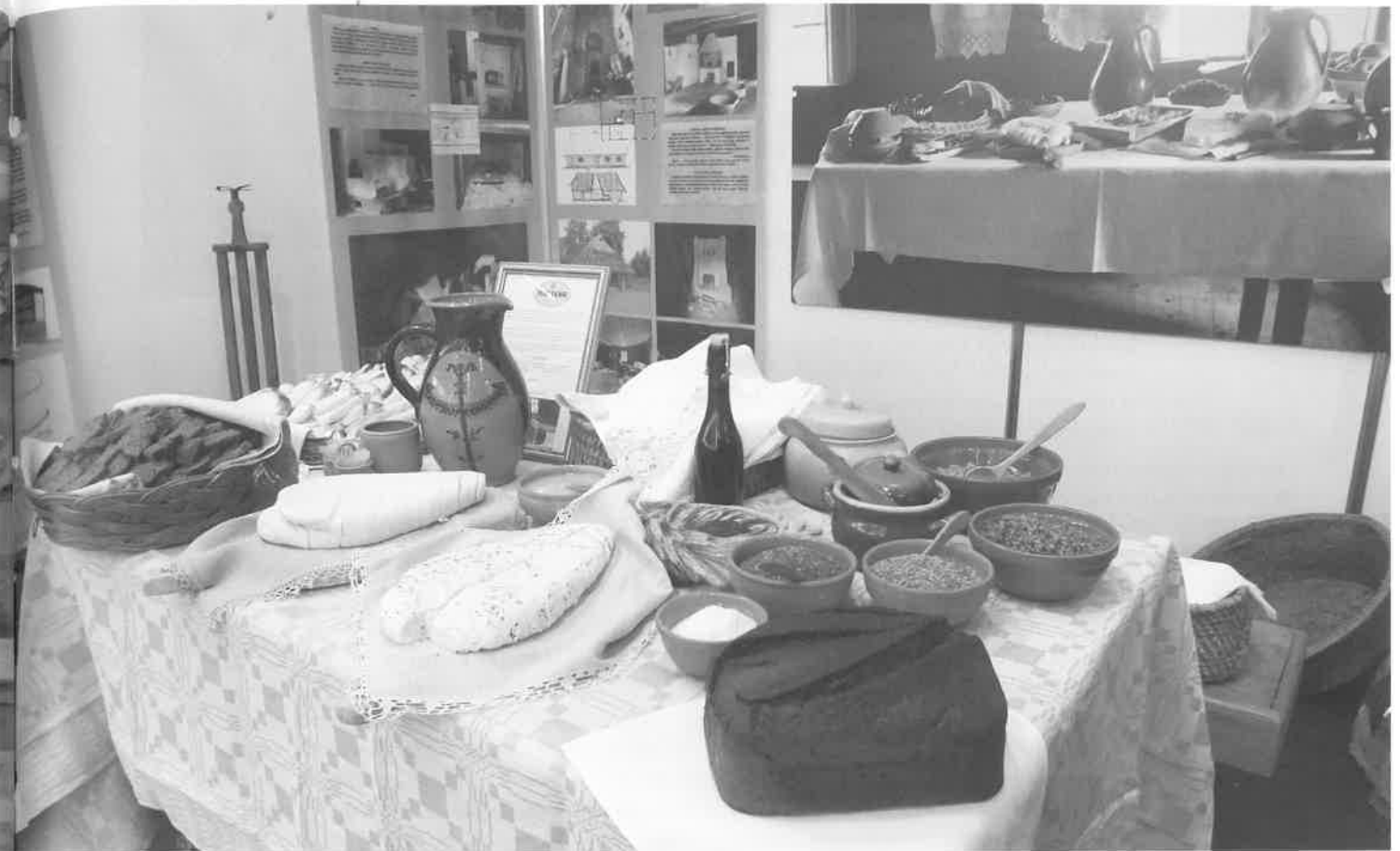
Tradicinės lietuviškos vaišės, 2015 m.

(spirgūtis), kurį valgo su bulvėmis. Tradicinis patiekalas – kanapinis pienas , kuris gaunamas ant trintų kanapių užpilant šilto vandens. Kanapių rasalas – į kanapių pieną įmaišyta sutrinta silkė su svogūnais. Patyrusios žemaičių šeimininkės iš kanapių moka išvirti netgi košę.