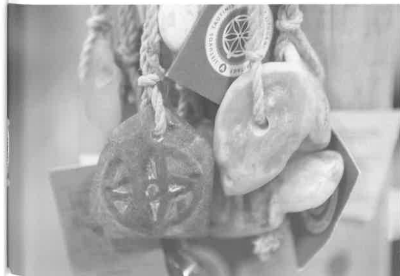
Gintariniais amuletais mielai puošiamasi ir šiandien, 2015 m.

Žemaičiai augindavo daug linų. Tradiciniai jų apdorojimo būdai jaujose išlaikė labai senoviškus papročius. Ypač savitas naktimis vykdavęs žemaičių linamynis, pilnas jaunimo linksmybių, išbandymų ir žaidimų, į kuriuos įsitraukdavo ir persirengėliai. Viena iš įdomiausių linamynio apeigų, pasižyminti mitologine prasme, – „kuršio nešimas“ (linamynio darbuose atsiliekančiams kaimynams buvo gabenama pamėklė kuršis ).