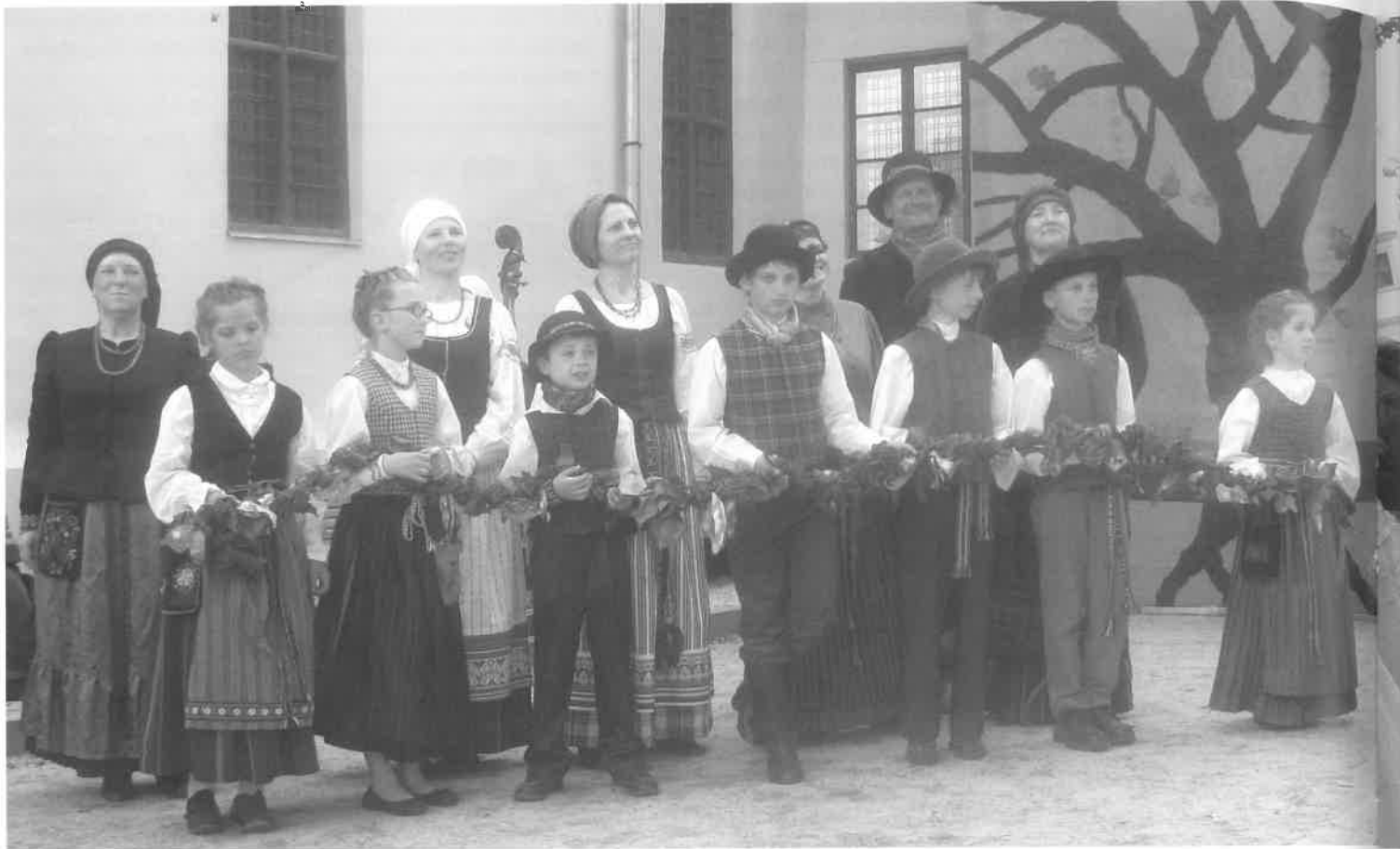
Mažosios Lietuvos folkloristai ir vaidintojai su savo regiono tautiniu kostiumu Teatro dieną Dainų šventėje. 2014 m., Bernardinų sodas, Vilnius.

paversti baudžiauninkais, suvaryti į gatvinius kaimus, kur teko glaustis siauresniuose sklypuose, apsieiti su mažesniais trobesiais. Daugiau laisvės ir senovinių pastatų išliko tik krašto bajorų sodybose, kur būta didžiųjų tvartų, erdvių svirnų ir stambių trobų. Dvarelių savininkai ar stambesni ūkininkai (kurių pagausėjo XIX a.) mėgo savo didžiąsias sodybviertes apsodinti ąžuolų ar kitų tradicinių medžių juostomis, nuo žvarbių šiaurės vėjų gintis žalių eglių eilėmis.