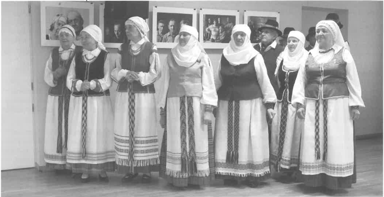
Rokiškio folkloro ansamblio „Gastauta“ moterys pasipuošusios aukštaičių tautiniu kostiumu, 2015 m.

Rytų Dzūkijos muzikiniam dialektui – kartais nustatyti ribą tarp rytų aukštaičių ir rytų dzūkų labai sudėtinga.