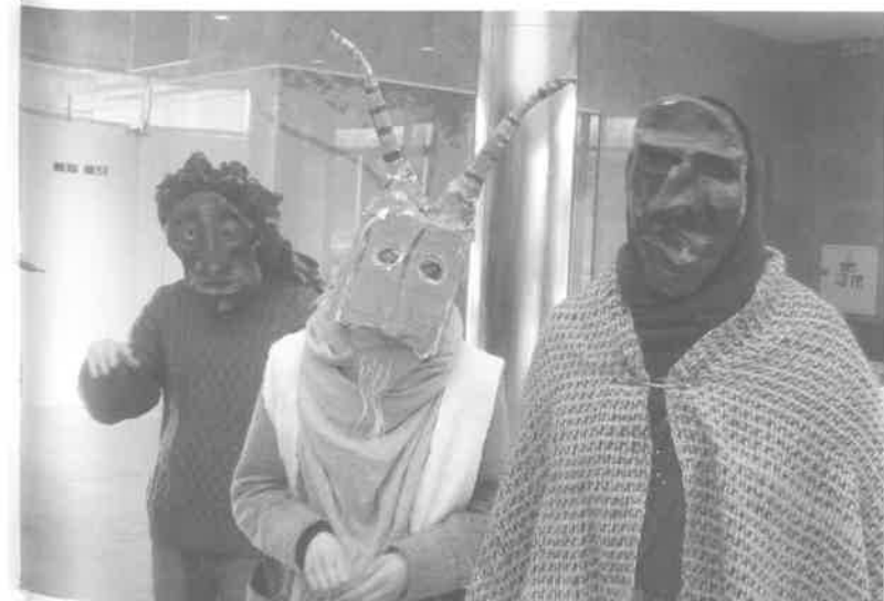
Per Užgavėnės LMTA ir EKGT nariai su kaukėmis LR Seime, 2014 m.

Instrumentinė muzika – taip pat svarbi ir savita. Žemaičiai nuo seno skambino kanklėmis, pūtė švilpynes ir birbynes. Vėliau buvo pradėta groti smuikais, armonikomis, basetlėmis ir kitais instrumentais. Žemaičiuose ypač mėgstami nedideli dūdų orkestrai, kuriais grota