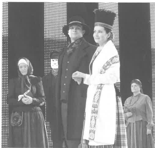
Lietuvininkų tautinis kostiumas. 2015 m., Vilnius.

Tautinis kostiumas. XIX a. pirmojoje pusėje lietuvininkės moterys vilkėjo gausiai prie kaklo rauktais, puošniai siuvinėtais marškiniais ir trumpomis liemenėmis. Virš languoto arba išilgai dryžuoto raukto sijono ryšėdavo baltas linines prijuostas su įustais raudonais raštais. Šaltuoju metu vilkėdavo sermėgomis bei kailinukais, aprauktais tamsiai mėlyna medžiaga, puoštais siuvinėtais raštais ir auksaspalvių galionėlių arba kailiuko apvadais ant pečių ir rankovių. Liemenį juosdavo plačiomis rinktinėmis juostomis, o prie juosmens pasikabindavo delmoną – puošniai siuvinėtą medžiaginį maišelį. Puošėsi stikliniais arba gintariniais karoliais. Merginos plaukus pindavo į kasas, kurias sudėdavo apie galvą labai sudėtingais būdais, – tokia šukuosena